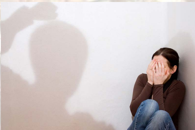
Круговая модель насилия

Этот треугольник ещё называют магическим, так